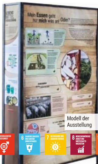
Modell der Ausstellung

Ernährung, Kleidung, Mobilität, Wohnen, technische Geräte und der Übergang unserer Gesell- schaft auf einen nachhaltigen Entwicklungspfad sind Themen der Ausstellung